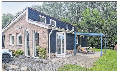
Vollenhove: Das Chalet „Lachs“.