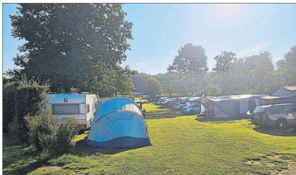
Für die klassischen Zelturlauber ist in beiden Parks natürlich auch Platz.