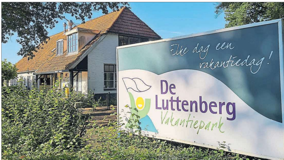
Der Eingangsbereich des Ferienparks De Luttenberg im gleichnamigen Ort in der niederländischen Provinz Overijssel.