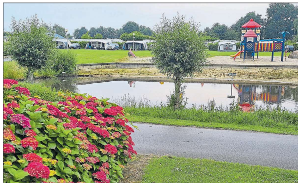
Zelte und Wohnwagen im Hintergrund, See und Spielplatz im Vordergrund.