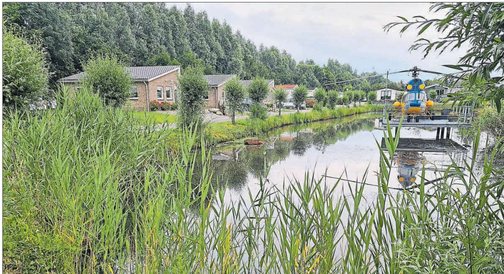
Eine Reihe von Chalets im Vakantiepark t'Akkertien in Vollenhove.

Weitere Infos unter: www.hollandcampings.de www.das-andere-holland.de www.akkertien.de www.luttenberg.nl/de www.visitwente.de