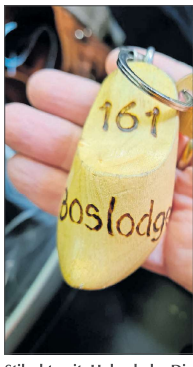
Stilcht mit Holzschuh: Die Schlüssel für die Unterkünfte.